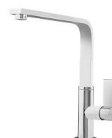
Miscelatore NYC 8486 000