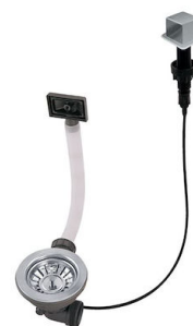
Piletta automatica LIRA 8407 103