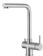
Miscelatore Gamma 3 vie - satinato 8496 100